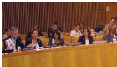
י"ר הקרן נאם באו"ם

י"ר קרן מלכי נואם בסימפוזיון מיוחד של האו"ם שהוקדש לקורבנות טרור