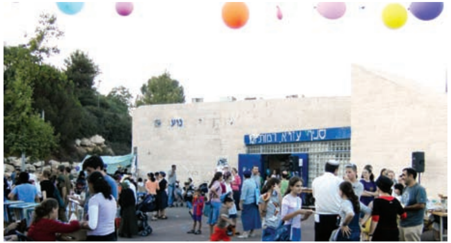
הבזאר השנתי, "עזרא" רמות

תודה מיוחדת לקרן סובל (The Sobell Foundation) מבריטניה על תמיכתה המתמשכת בקרן, ועל החלטתה להעניק לנו תמיכה תלת-שנתית בפעילות הקרן!