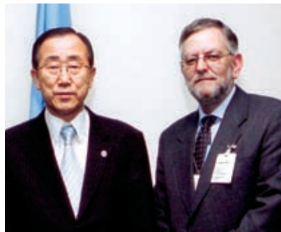
ארנוולד רוט ובאן קי-מון

הצטרפו גם אתם למעגל התומכים השותפים בשמחת הנתינה! פרטים במשרדי קרן מלכי, טל' 02-567-0602, או בדואר אלקטרוני.